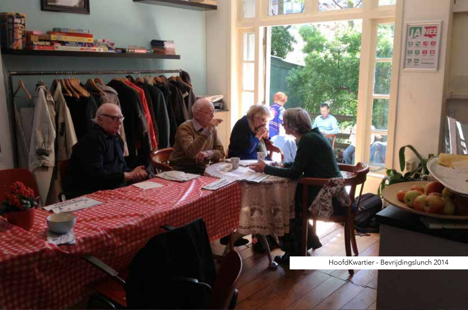
Hoofdkwartier - Bevrijdingslunch 2014