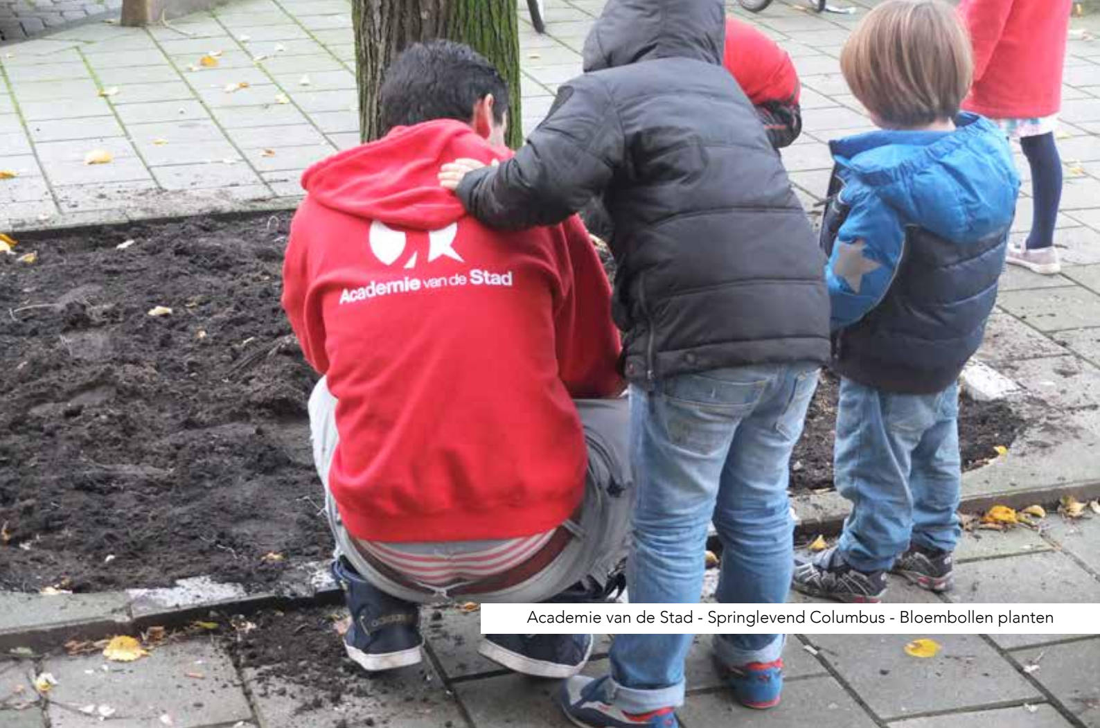
Academie van de Stad - Springlevend Columbus - Bloembollen planten