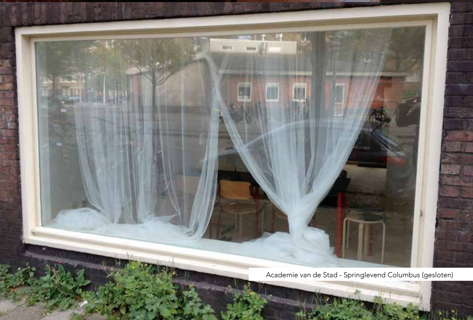
Academie van de Stad - Springlevend Columbus (gesloten)