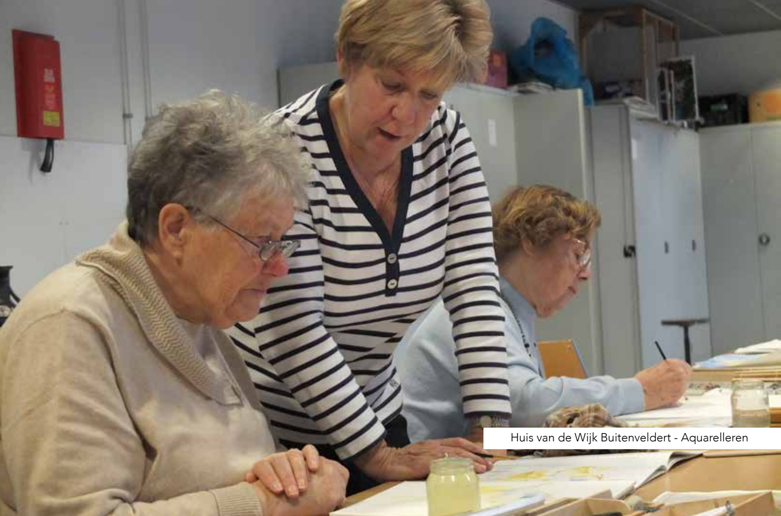
Huis van de Wijk Buitenveldert - Aquarelleren