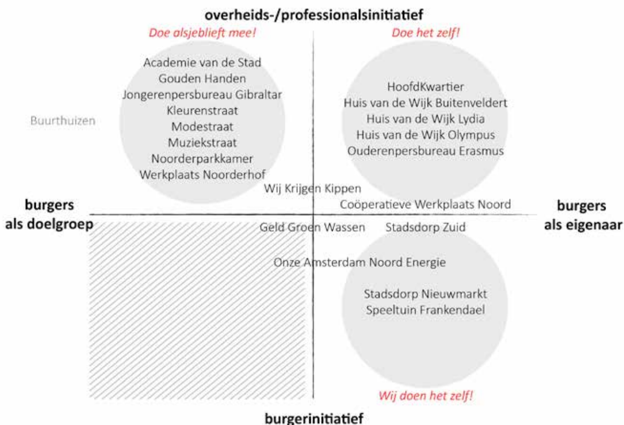
Figuur 2. Bestudeerde Amsterdamse buurtinitiatieven naar type.

Om te onderzoeken hoe eigenaarschap werkt, hebben we een brede selectie gemaakt uit recente Amsterdamse buurtinitiatieven. Een overzicht van bestudeerde initiatieven is te vinden in Figuur 2 . Elk initiatief of project is tenminste één keer bezocht en er is telkens uitgebreid gesproken met minstens één betrokkene, veelal iemand die een centrale rol speelt. Met de respondent zijn verschillende aspecten in kaart gebracht die medebepalend zijn voor eigenaarschap, zoals wie het initiatief heeft genomen, hoe het initiatief is gefinancierd, wie formeel en wie in de praktijk verantwoordelijkheden draagt. Het volledige overzicht van aspecten die in ogenschouw zijn genomen is te vinden in Bijlage 1 . Op basis van de respons op deze vragen is bepaald hoe eigenaarschap bij verschillende initiatieven werkt.