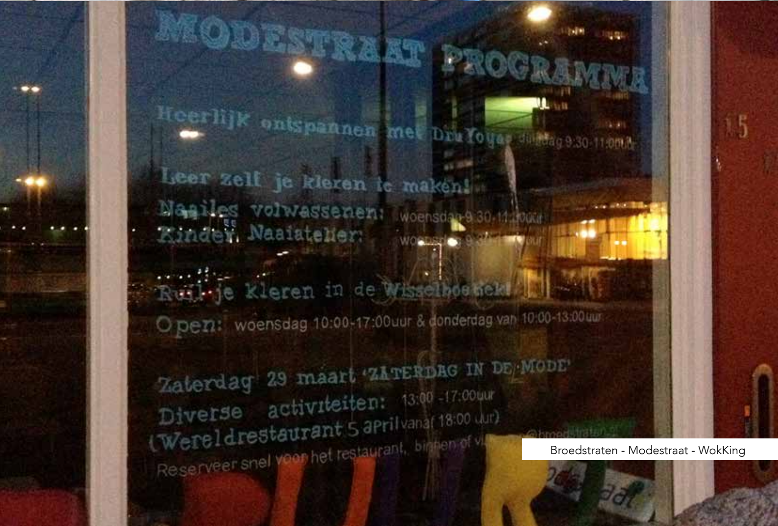
Broedstraten - Modestraat - WokKing