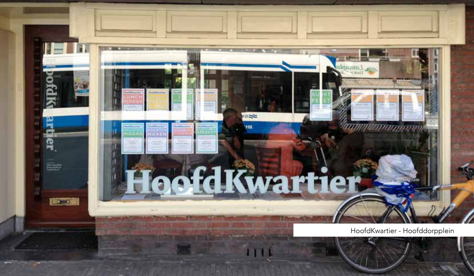
HoofdKwartier - Hoofddorpplein