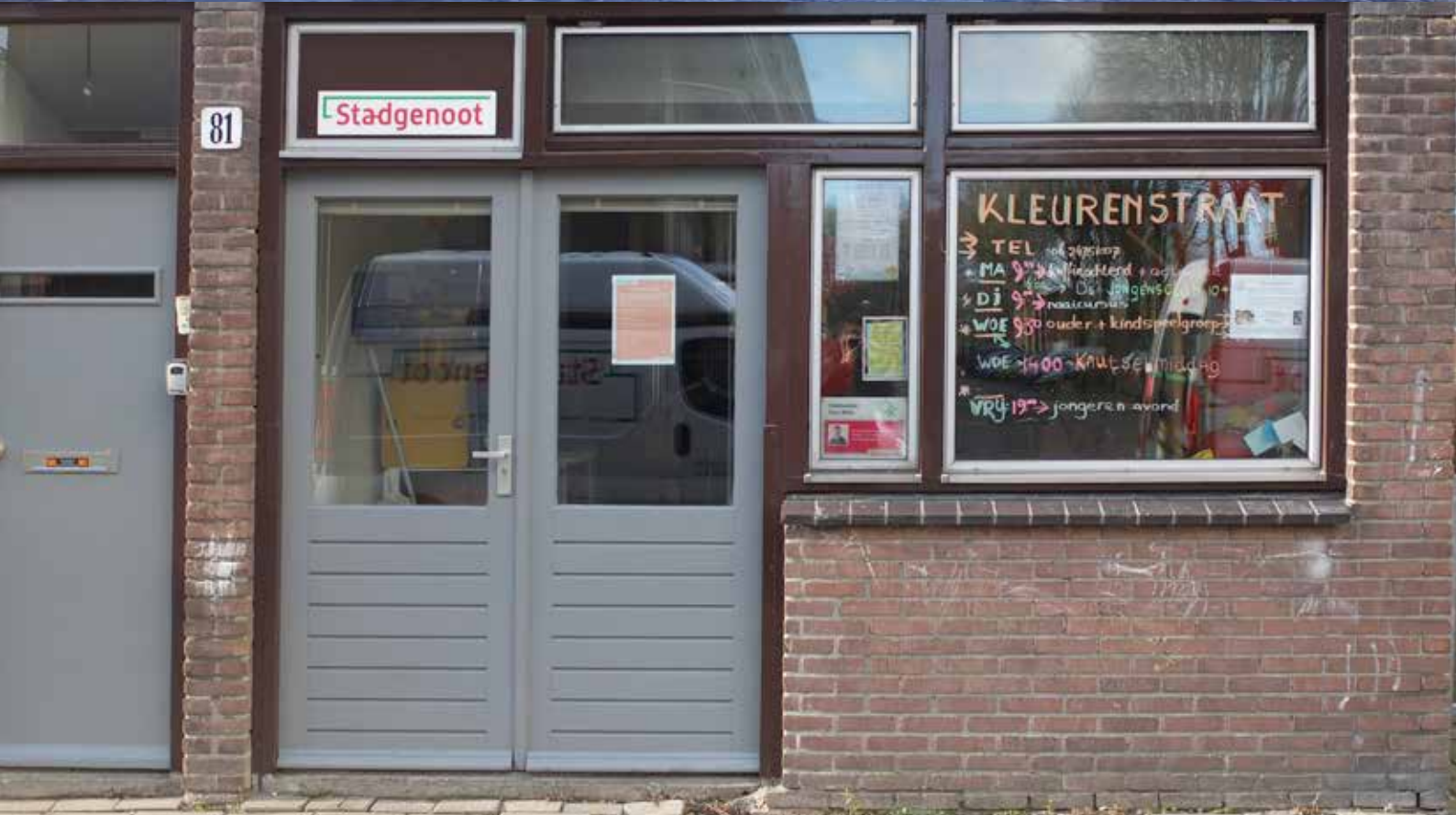
Broedstraten - Kleurenstraat - Klipperstraat 81